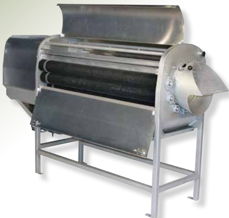
Modelo 2420 con seis rodillos

El modelo 2420 de Vanmark es la más eficiente peladora de su clase. Es ideal para la industria moderna.