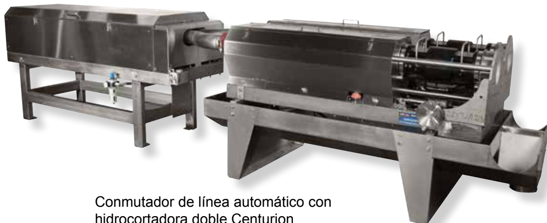
Conmutador de línea automático con hidrocortadora doble Centurion

Cambia en 1/10 de segundo eliminando el tiempo perdido en bloqueos o inactividad de la línea.